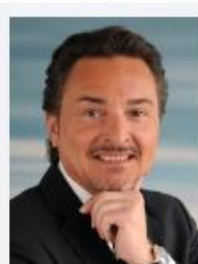
Speck, Hermann Speck Pumpen Verkaufsgesellschaft GmbH