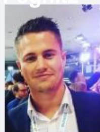
Eibl, Maximilian Elektro Eibl GmbH