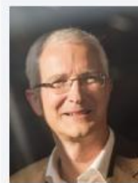
Endres, Klaus Getränke Ziegler GmbH