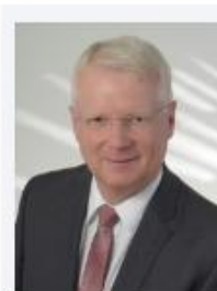
Lorenz, Hermann Reifen Lorenz GmbH