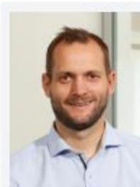
Wexler, Alexander EuWe Eugen Wexler GmbH