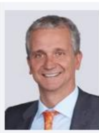
Knienieder, Gerhard EMUGE-Werk Richard Gimpel GmbH&Co.KG