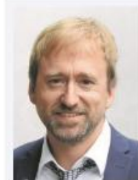
Herrmann, Kai Verlag Hans Fahner GmbH & Co. KG